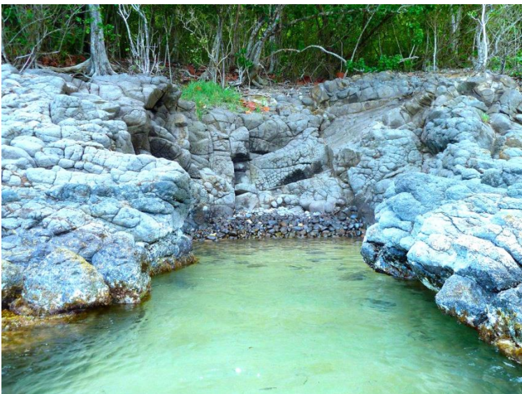
Temple de Sophia près de la plage de la Perle en Guadeloupe