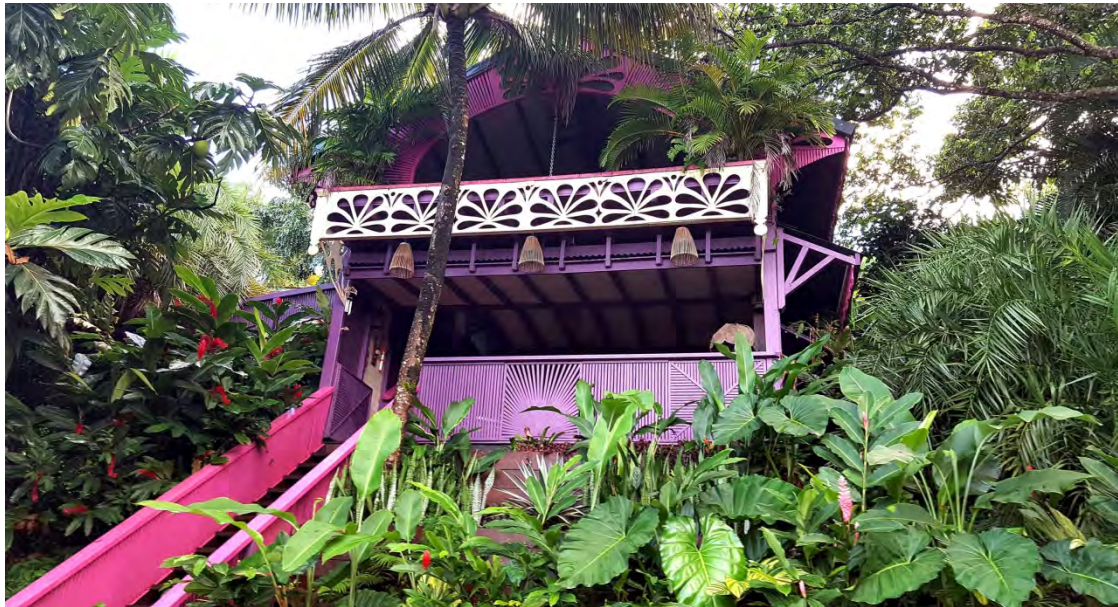
Maison sur le lieu du stage

Stage de quatre jours ouvert à tous ceux qui veulent commencer le cycle d'enseignement sur la géobiologie ou à ceux qui veulent simplement avoir de bonnes bases en géobiologie. Priorité sera donnée aux personnes ayant déjà effectué l'initiation au clair ressenti.